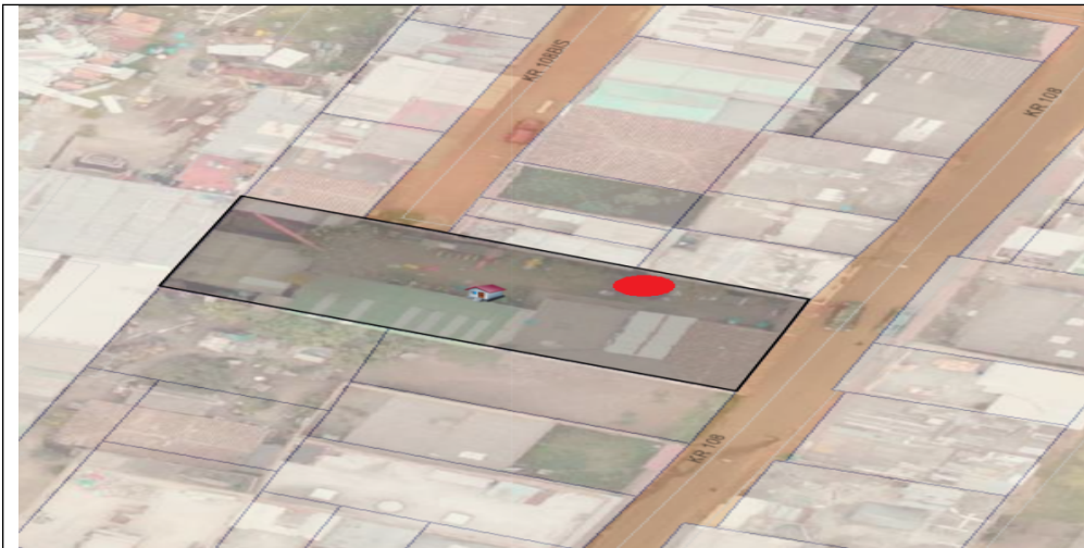
Imagen 2. Ubicación del pozo en el predio

De acuerdo a lo evidenciado en la visita técnica realizada el día 16/06/2017 al aljibe identificado con código aj-11-0201, ubicado en la dirección KR 108 153 41 de la localidad de Suba, cuya propietaria es el usuario Grace Mendieta, del JARDIN INFANTIL PEQUEÑITAS Y PEQUEÑITOS DE JESUS donde se desarrollan las actividades de educación de la primera infancia y educación preescolar. El aljibe se encuentra ubicado en la parte norte del predio (Entrada al Jardín).