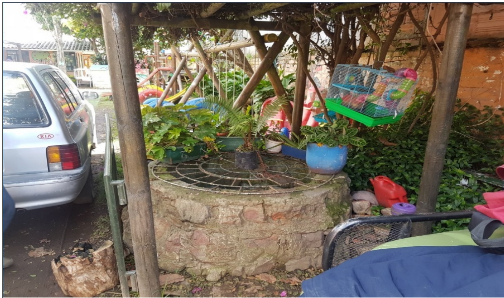
Foto No. 1 Vista general Aljibe aj-11-0201

A continuación, se deja evidencia fotográfica sobre lo encontrado del aljibe aj-11-0201.